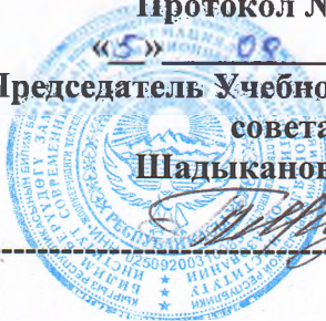
График открытых уроков занятий ПС отделения «Лечебное дело»