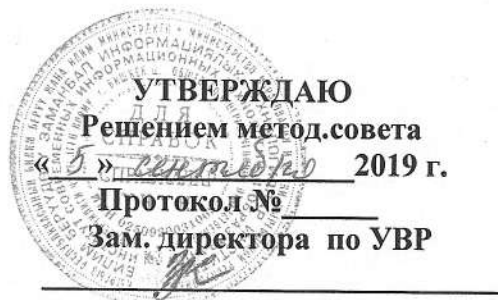
График открытых занятий в Чуйском ПК на 2019-20 учебный год.