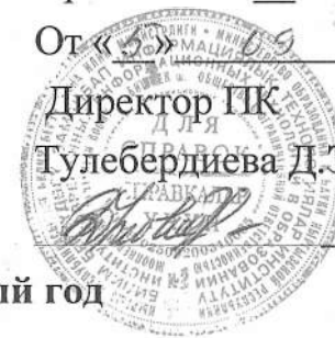
График гостевых лекций за Цсеместр на 2019-2020 учебный год Кафедры «Правовых дисциплин»