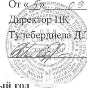
График проведения открытых занятий на 2019-2020 учебный год Кафедра «Правовых дисциплин»