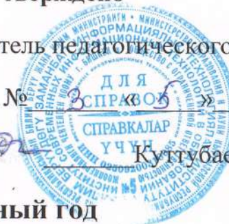
График гостевых лекций за 2019-2020 учебный год

Специальность: 050709 « Преподавание в начальных классах »