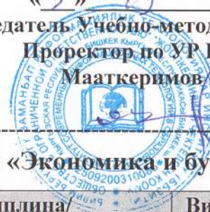
График взаимопосещения занятий ПС специальности «Экономика и бухгалт. учет»